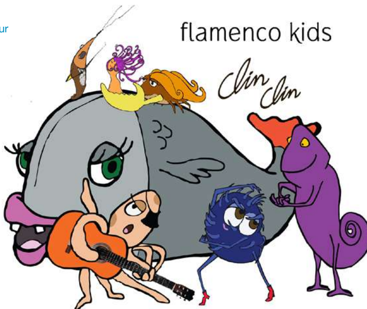
Ilustración: Teresa del Pozo